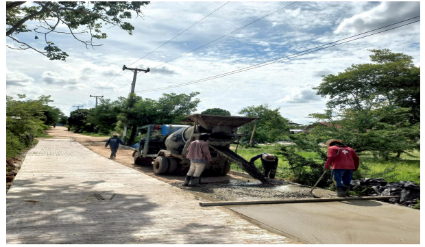
โครงการก่อสร้างถนนแอสฟัลท์ติกสายบ้านหนองคู บ้านหนองคู หมู่ที่ ๕